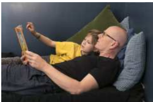
Schule und Kita zu! Was nun? - Tipps zum Lernen zu Hause

www.elternguide.online/2020/03/20/schule-und-kita-zu-was-nun-tipps-zum-lernen-zu-hause/